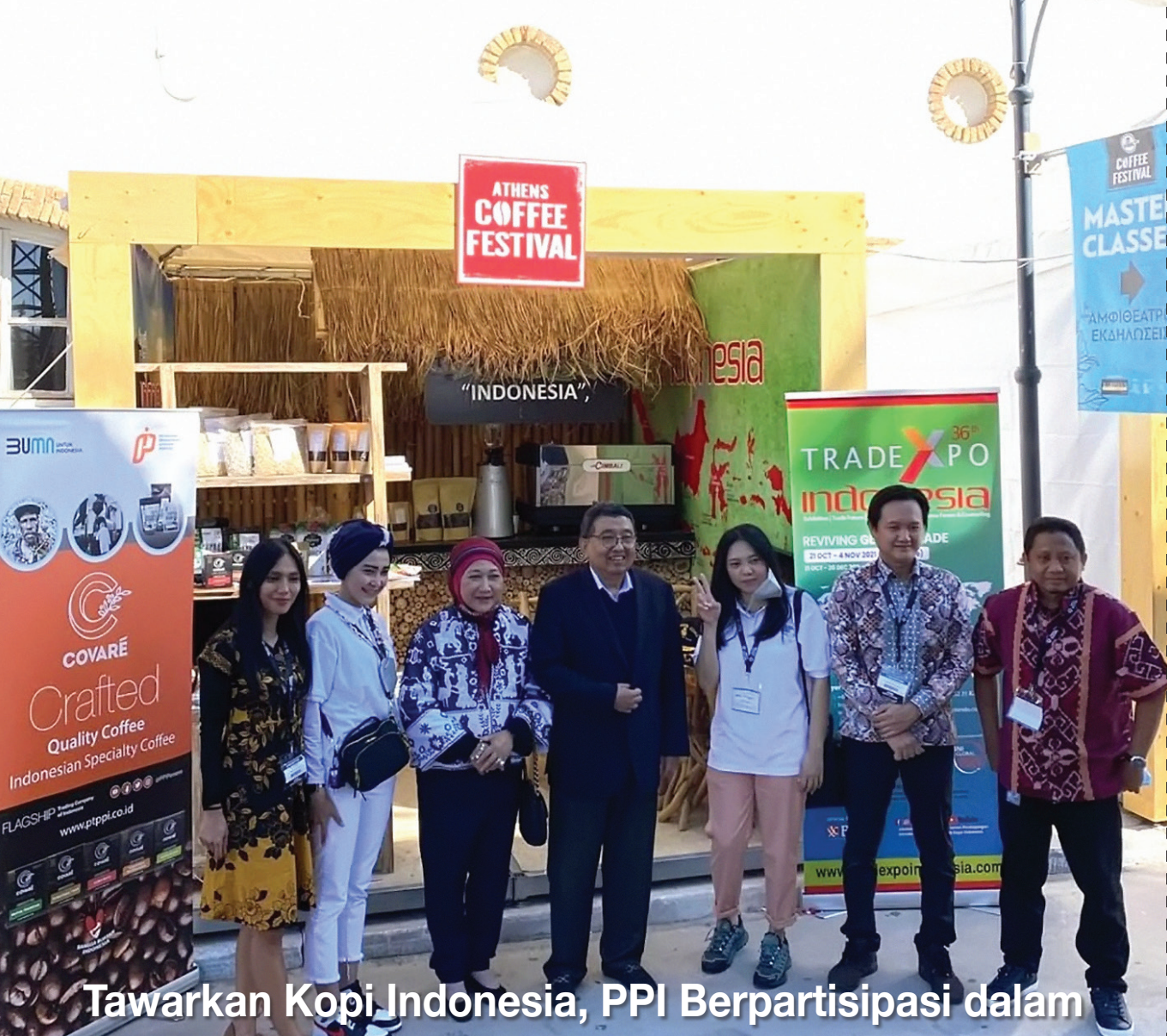
Tawarkan Kopi Indonesia, PPI Berpartisipasi dalam