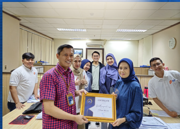
JUARA 1 Divisi Manajemen Keuangan