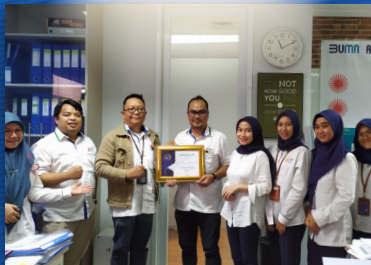
JUARA 2 Divisi Perdagangan Non Bahan Pokok