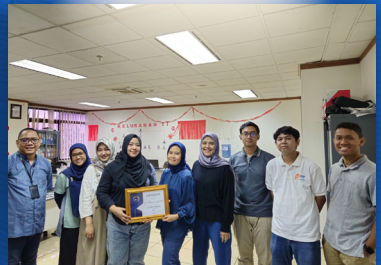
JUARA 3 Divisi Teknologi Informasi dan ERP