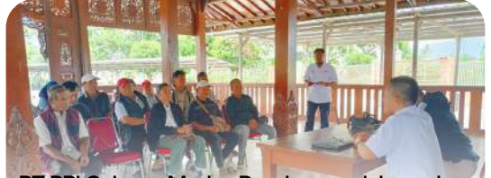
PT PPI Cabang Madya Bandung melaksanakan penandatanganan Surat Perjanjian Jual Beli (SPJB) bersama PUD dan PPTS pupuk bersubsidi di wilayah kerja Kabupaten dan Kota Bandung untuk Tahun 2026.