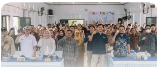
PT PPI Cabang Madya Madiun melaksanakan penandatanganan SPJB bersama seluruh PUD dan PPTS se-Kota dan Kabupaten Madiun untuk Tahun 2026.