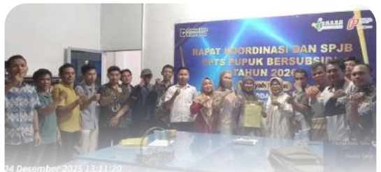
PT PPI Cabang Pratama Bengkulu melaksanakan penandatanganan SPJB serta kunjungan ke PPTS pupuk bersubsidi.