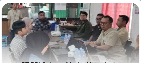
PT PPI Cabang Madya Yogyakarta melaksanakan rapat koordinasi bersama PUD dan PPTS pupuk bersubsidi di Kabupaten Gunungkidul.

RDKK : Rencana Definitif Kebutuhan Kelompok PUD : Pelaku Usaha Distribusi PPTS : Penerima Pupuk pada Titik Serah