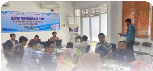
PT PPI Cabang Madya Banjarmasin melaksanakan rapat koordinasi bersama PUD terkait penyaluran pupuk bersubsidi.