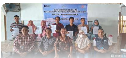
PT PPI Cabang Madya Palu melaksanakan penandatanganan SPJB pupuk bersubsidi untuk Tahun 2026.