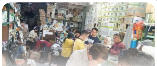
PT PPI Cabang Madya Malang melaksanakan kegiatan meeting rutin serta kunjungan ke pelanggan pestisida.