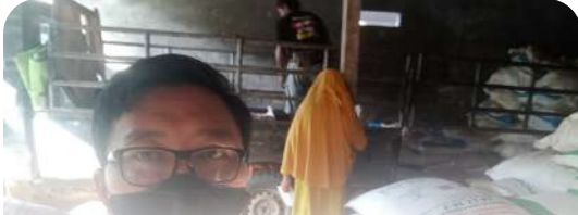
PT PPI Cabang Madya Balikpapan melaksanakan pengawasan penyaluran pupuk bersubsidi serta diskusi bersama petani e-RDKK di PPTS UD Sumber Tani Sejahtera Paribau, Kabupaten Berau, Kalimantan Timur.