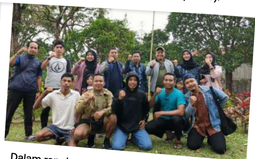
Dalam rangka meningkatkan kekompakan dan kebersamaan, Insan PT PPI Cabang Utama Makassar melakukan family gathering di Wisata Malino pada Sabtu-Minggu, (16-17/08/2025).