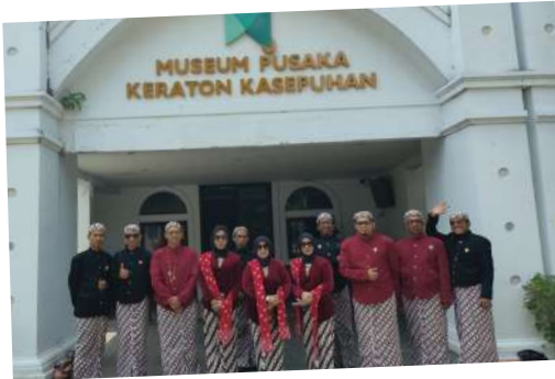
PT PPI Cabang Madya Cirebon melakukan kunjungan ke Keraton Kasepuhan Cirebon pada Senin, (11/08/2025).