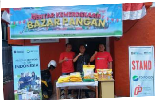
PT PPI Cabang Pratama Pontianak turut serta menggelar Gebyar Kemerdekaan Bazar Pangan pada Selasa, (12/08/2025).