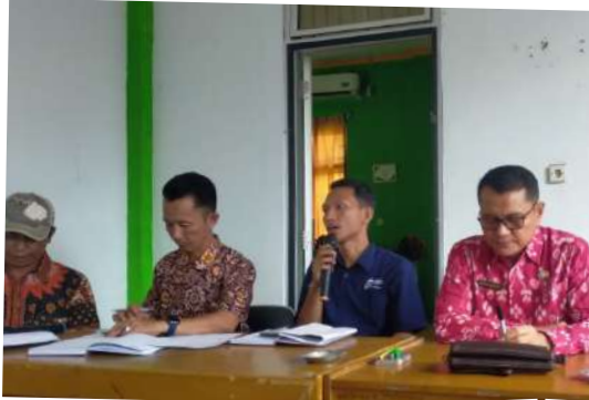
PT PPI Cabang Pratama Bengkulu, PT Pupuk Indonesia, dan Dinas Pertanian Kab. Selama menggelar pembinaan penyuluh dan petugas yang bertanggung jawab dalam penginputan usulan RDKK Pupuk Subsidi Tahun 2026, pada Kamis, (21/08/2025).