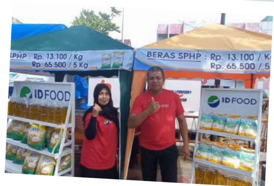
Jaga stabilitas pasokan dan harga pangan, PT PPI Cabang Madya Banda Aceh menggelar Gebyar Kemerdekaan Bazar Pangan pada Selasa, (12/08/2025).